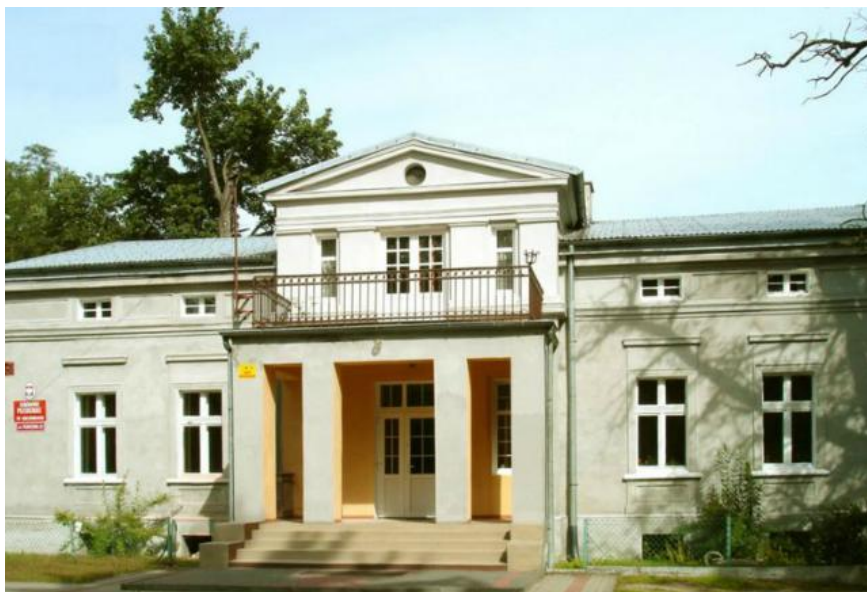
Rysunek 5. Dwór w Galewiczach