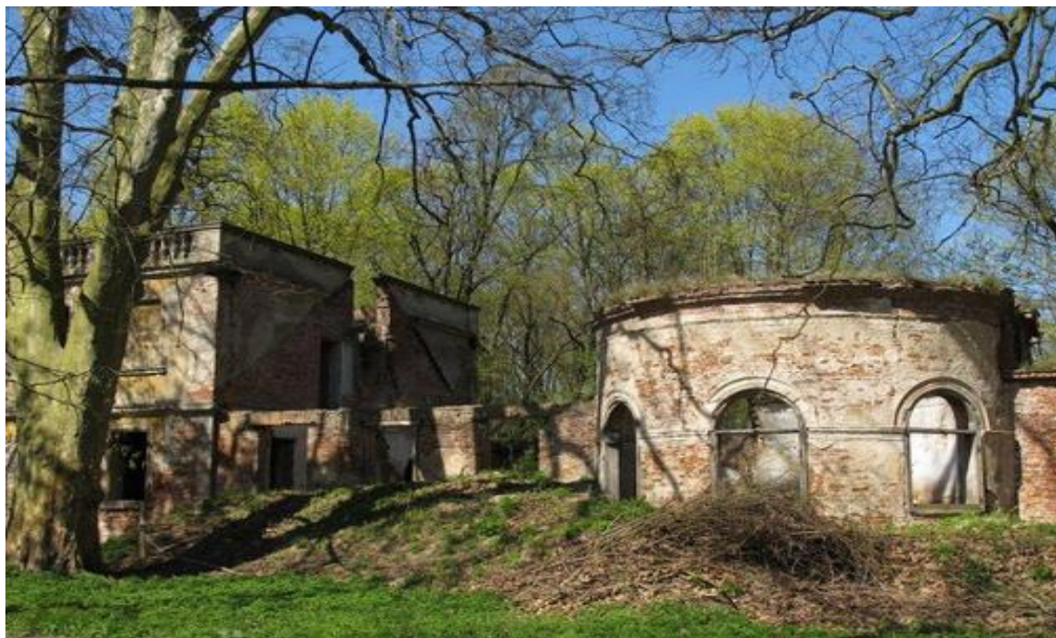
Rysunek 4. Ruiny dworku w Parcicach