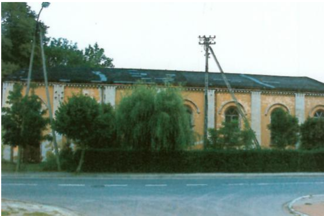
Rysunek 10. Zespół dawnej Synagogi w Lututowie