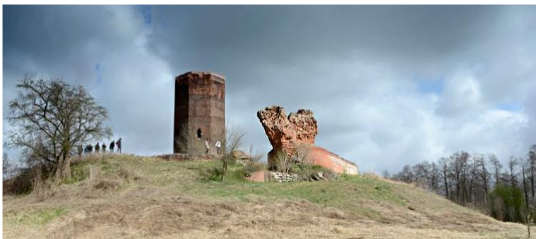
Rysunek 3. Ruiny zamku w Bolesławcu

Na terenie Gminy Bolesławiec obiektem zabytkowym o najwyższym znaczeniu są ruiny zamku.