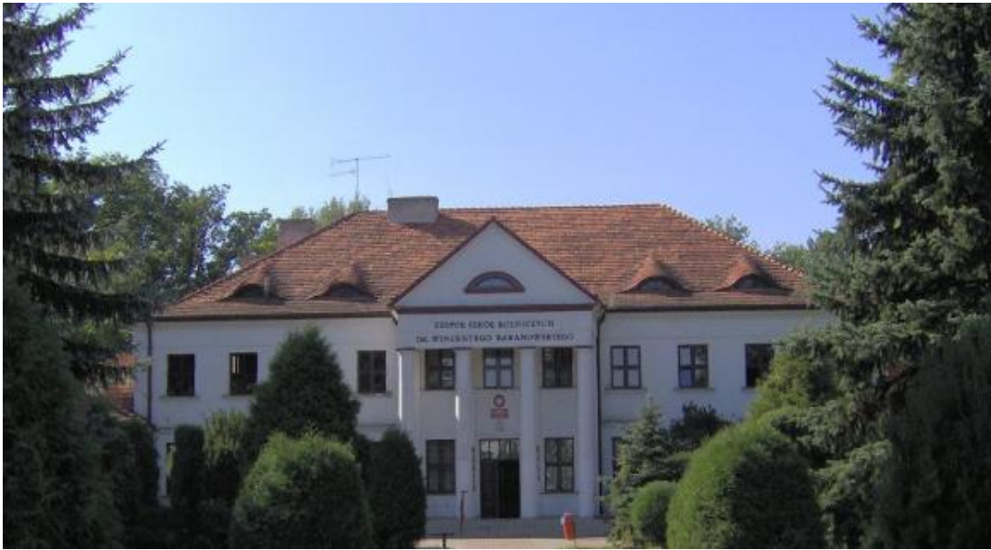
Rysunek 9. Dwór w Lututowie