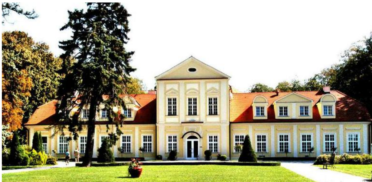
Rysunek 13. Pałac w Sokolnikach