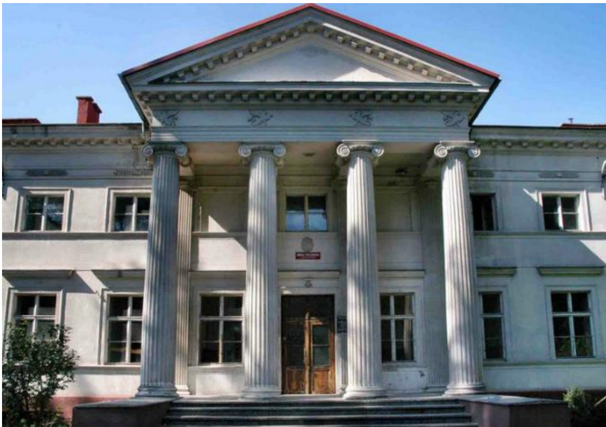
Rysunek 14. Pałac w Walichnowach

restaurację. Wnętrze nie zachowało swojego pierwotnego charakteru. Całość zespołu pałacowego otacza park z cennymi gatunkami roślin i drzew.