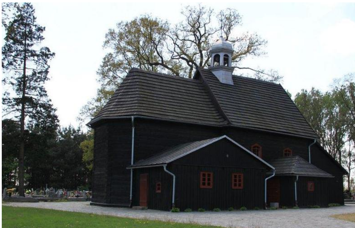
Rysunek 16. Kościół cmentarny p.w. św. Rocha w Kuźnicy Skakawskiej

Kościół cmentarny p.w. św. Rocha wzniesiono w 1746 r. z inicjatywy Ks. Pawła Tujkiewicza dzięki wieruszowskim parafianom. Wykonany jest z drewna modrzewiowego. Wewnątrz kościoła zobaczyć można polichromię ze scenami Nowego i Starego Testamentu. Ważnym elementem obiektu są ołtarze, które charakteryzują się stylem renesansowym z niewielkimi elementami barokowymi.