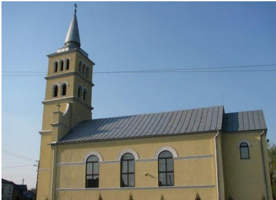
Rysunek 17. Kościół parafialny p.w. św. Michała Archanioła w Wyszanowie