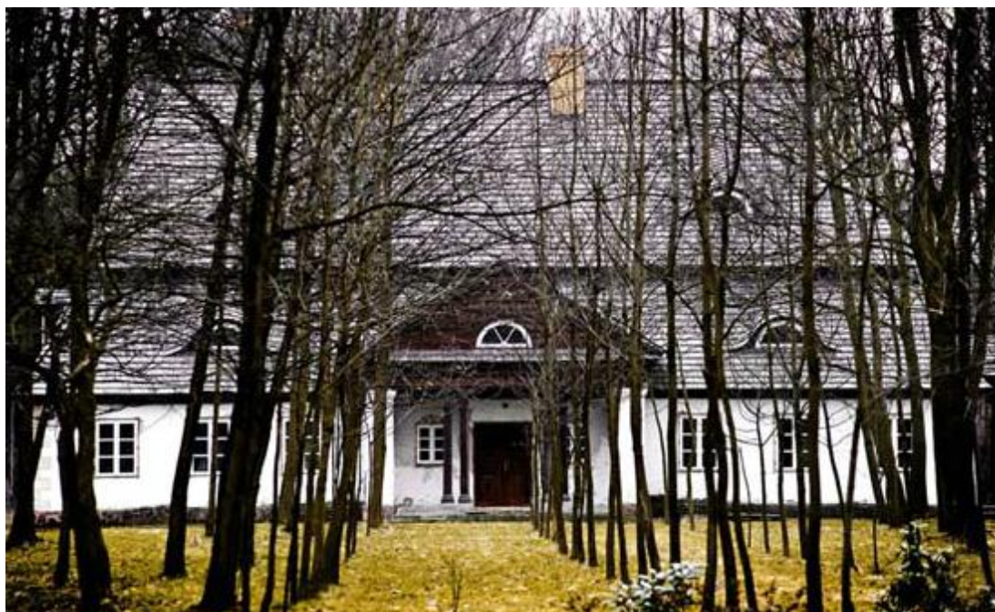
Rysunek 7. Dwór w Świątkowicach

Na terenie Gminy Lututów najwyższe znaczenie mają obiekty ujęte w rejestrze zabytków Wojewódzkiego Oddziału Służby Ochrony Zabytków w Łodzi Delegatura w Sieradzu. Należą do nich dwór i park w Świątkowicach, będące własnością prywatną, obiekty sakralne (kościół i relikty zespołu dworsko-parkowego w Lututowie) będące pod opieką Administratora Parafii Rzymsko-Katolickiej w Lututowie, a także Rzeźba św. Jana Nepomucena, która znajduje się w izbie pamięci w Zespole Szkół Rolniczych w Lututowie.