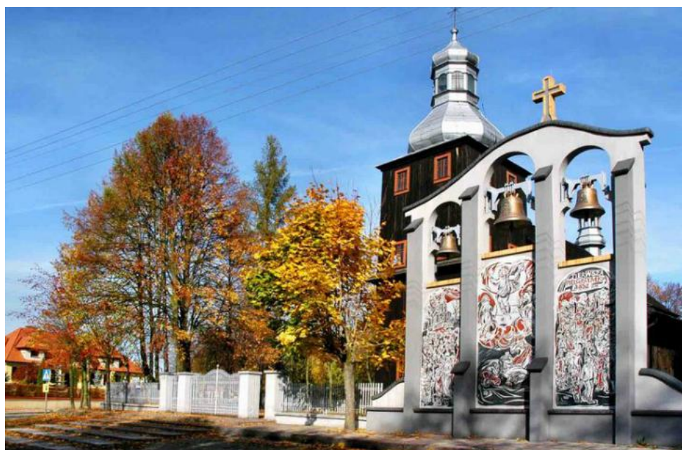
Rysunek 6. Zespół kościoła parafialnego p.w. św. Trójcy w Węglewiczach

Murowany dwór z drugiej połowy XIX w. położony w peryferyjnej części wsi Galewice w zachodniej jej części, na niewysokim pagórku i otoczony jest parkiem. Obecnie budynek jest zaadaptowany na potrzeby mieszczącego się w nim przedszkola. Na terenie parku znajduje się drzewostan liściasty i iglasty składający się z gatunków rodzimych. W granicach parku rośnie potężny dąb o obwodzie 390 cm, będący pomnikiem przyrody. Zespół dworsko-parkowy jest oazą spokoju i zieleni, miejscem spaceru i odpoczynku.