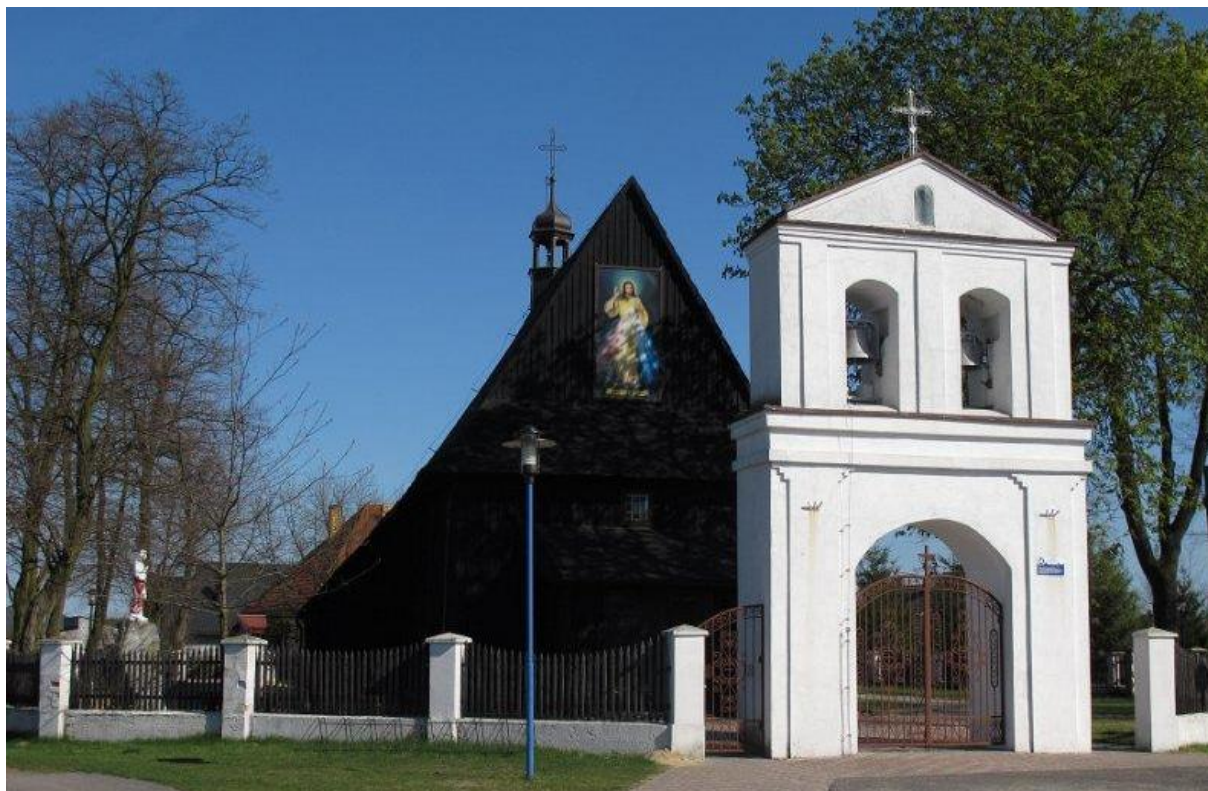
Rysunek 12. Kościół parafialny p.w. św. Anny w Starym Ochędzynie