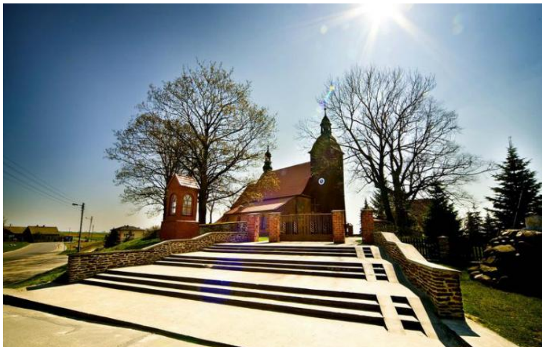
Rysunek 11. Kościół parafialny p.w. Wniebowstąpienia NMP w Łubnicach