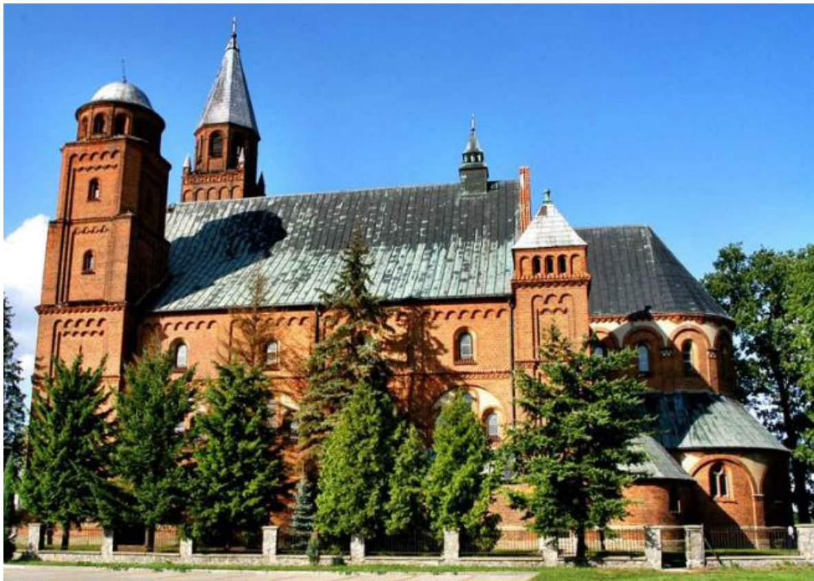
Rysunek 8. Kościół parafialny p.w. św. Piotra i Pawła